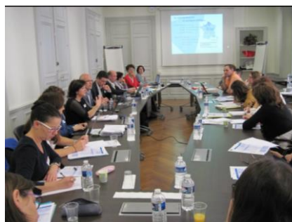
Atelier n°3 à la Banque de France, Pays de la Loire

Le Crédit Municipal de Nantes est à l'initiative de la micro épargne accompagnée solidaire et pilote d'une démarche de co-construction animée durant toute l'année 2017 . Des représentants des CCAS de Nantes, Angers, Rennes, Saint-Herblain, la Roche-sur-Yon, Laval et Tours ont apporté leur contribution en apportant leur expertise sociale et en se faisant écho du point de vue de futurs épargnants .