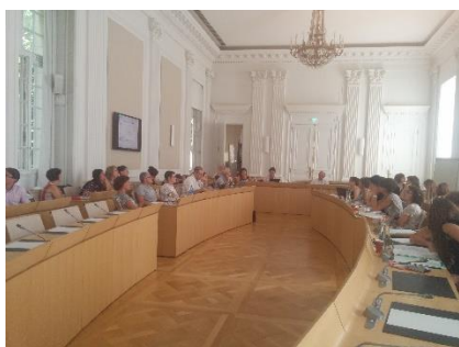
Atelier n°2 à la Mairie de Nantes